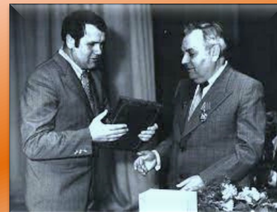
Теплые встречи с автором